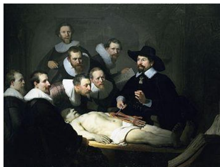
Fig. 3 - A lição de anatomia do dr. Tulp

mimese também devem ter caráter mimético. Lukács justifica essa caracterização dizendo que “os objetos representados e igualmente as relações entre eles e com o espaço que os cerca, que eles preenchem, pertencem a um sistema de complicadas interações, se convertendo em um espaço concretamente evocador”. Portanto, tais objetos não são mais um acréscimo secundário, determinável por categorias abstratas geométricas (no sentido de decorativos). De acordo com o filósofo, na principal corrente evolutiva da pintura, a composição nascente detém princípios que podem derivar da coexistência tridimensional de figuras humanas e objetos da natureza de suas relações (de seu dramatismo, por exemplo, como ocorre de forma diversa no afresco A crucificação de São Pedro (Fig. 2, 1545-1550), de Michelangelo, e no óleo A lição de anatomia do Dr. Tulp (Fig. 3, 1632), de Rembrandt, ou de sua função representativa como é frequente na obra de Rafael,