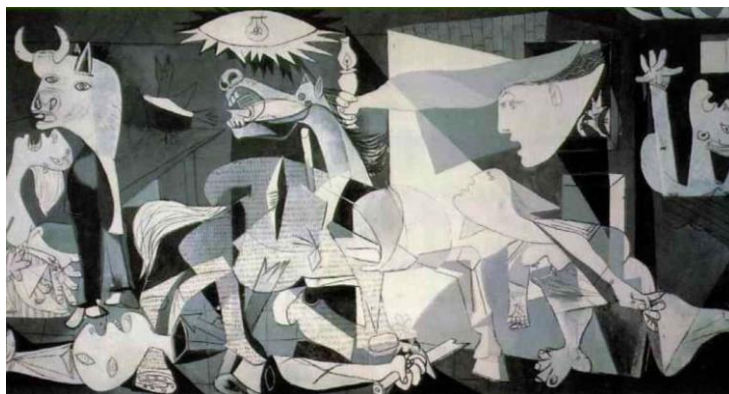
Fig. 21 - Guernica

Apesar disso, a generalização lukácsiana afirmando que o que foi produzido se encaixa num modismo superficial, não condiz com o fato de uma parcela significativa das pinturas de artistas como Picasso (Fig. 21, 1937), a despeito do caráter decorativo da mimese pictórica, e com todas as suas diferenças e contradições estilísticas e estéticas, produziram muito mais do que apenas registros históricos fundamentais, como suas obras foram seminais para a compreensão de um novo modo de interpretar o mundo.