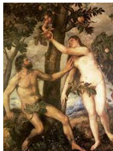
Fig. 18 - A tentação de Adão e Eva

Retomando e seguindo adiante na abordagem dos conflitos internos do naturalismo, citamos os observados entre o intelectualismo formalista do legado artístico da pintura da renascença clássica e a liberdade pictórica dos artistas