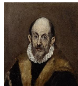
Fig. 14 - Autorretrato