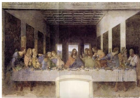
Fig. 9 - Última Ceia, Leonardo da Vinci, 1498

1972, p. 174). De acordo com ele, na pintura, as tendências ornamentais-decorativas se encontram, por sua essência estética, “ao serviço de uma consumada conformação artística da mimese”. Observa ele como ressalva que “o fato de historicamente serem produzidos com frequência quadros nos quais o predomínio do princípio decorativo leva à superficialidade ou variedade, ou a do princípio mimético à desordem artística, é algo que não afeta a validade dessa afirmação” (LUKÁCS, 1972, p. 174). Nesse sentido, Lukács encaminha a conclusão da sua abordagem oferecendo um exemplo, a partir de Wölfflin (1982), comparando os respectivos