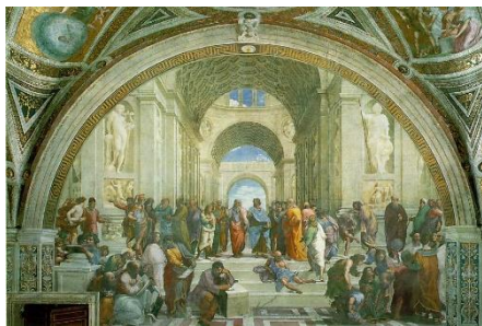
Fig. 4 - A Escola de Atenas

especialmente no afresco A Escola de Atenas (Fig. 4, 1511). De acordo com o filósofo húngaro, os princípios ordenadores da mimese voltada para a universalidade, têm a característica do estético (artístico) pleno já em suas origens, nascendo organicamente em cada caso “a partir do ser concreto, portanto, do conteúdo a ser modelado, generalizando a sua singularidade da maneira específica à arte”, justificando assim “a inesgotável variedade histórica e individual das composições originadas neste campo”, não necessariamente isso significando um “arbítrio subjetivista” (LUKÁCS, 1972, p. 167).