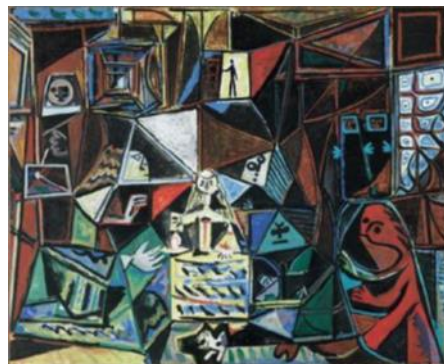
Fig. 20 - As meninas - estudo

No quadro exposto no Museu do Prado, o espectador pode reconhecer os temas das tapeçarias expostas ao fundo da tela na parte superior do espelho que reflete a imagem do casal real, cujos significados históricos remetem a uma iconografia de disputas mitológicas, como a disputa de Hera versus Aracne em torno da melhor tecelã, e de Apolo versus Mársias sobre quem era o melhor músico. Além disso, no autorretrato de Velázquez ele se representa como um pintor destro, o que seria no mínimo estranho considerando que sendo ele destro e todo o quadro um reflexo do grande espelho, sua representação segurando o pincel seria com a mão esquerda diante do espectador, tal como Picasso o retratou num de inúmeros estudos realizados na primeira metade da década de 1950 sobre As meninas (Fig. 20). Portanto, é factível considerar que o dramatismo interno explorado por Rembrandt no quadro anteriormente visto Os síndicos da guilda dos alfaiates , é reproduzido aqui pelo pintor ibérico. Um drama tramado em torno da disputa da autoridade sobre o autêntico conhecimento sobre a realidade social em meio às relações desiguais numa época de crescimento e consolidação do mundo burguês.