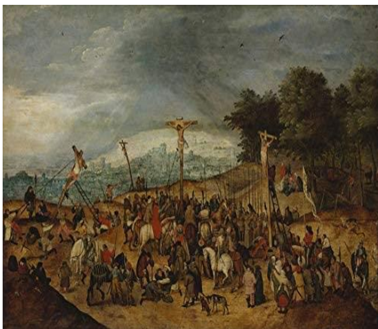
Fig. 8 - A crucificação