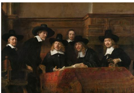
Fig. 7 - Os síndicos da guilda de alfaiates

Lukács faz referência aos estudos de Riegl para insistir no fato de que as relações entre as exigências sociais de conteúdos iconográficos, por exemplo, o retrato de um rei, de um papa, de um nobre ou de um burguês poderoso, e o conteúdo pictórico (estético/mimético) adotado pelo artista são “complicadíssimas” (LUKÁCS, 1972, p. 171). Ainda fazendo referência a Riegl, ele diz que o fato de determinados conteúdos iconográficos guardarem alguma convergência com a “solução formal”, não significa