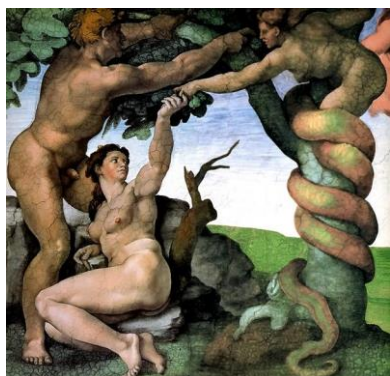
Fig. 17 - A tentação de Adão e Eva

Caminhando no sentido contrário à dialética marxiana, Lionello Venturi, respeitado historiador e crítico de arte italiano, contemporâneo de Lukács, considera a pintura “uma síntese de forma e conteúdo” (VENTURI, 1968, p. 89), conferindo a uma e outra uma acentuada autonomia relativa, diferentemente do que pensa Lukács, conforme vimos anteriormente. O crítico italiano parte da ideia de que os elementos constitutivos da composição estrutural da obra, tais como, proporção, simetria, dinamismo, plástica, volume, massa e anatomia, serão determinantes para a caracterização da forma artística pictural desde que em unidade com o conteúdo. Para Venturi, grosso modo, o conteúdo de uma obra estaria associado à temática espiritual desenvolvida pelo artista, cabendo registrar a esse propósito que ao atribuir à processualidade criativa/produzida de cada artista a busca da expressão individual, o historiador e crítico italiano tangencia a categoria da particularidade de Lukács. De fato, Venturi credita à particularidade do “artista autêntico uma concepção própria de