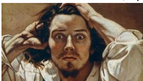
Fig. 15 - Autorretrato