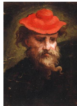
Fig. 13 - Autorretrato

Evidencia-se aqui uma contradição em termos no que diz respeito ao naturalismo como tendência estética das artes plásticas no interior do classicismo, sendo esta a primeira manifestação artística da era moderna. O naturalismo não apenas esteve presente na origem renascentista do classicismo em fins do século XV, como acompanharia a evolução deste último, tornando-se, de fato, a mais extraordinária tendência estética representada ao longo da existência do classicismo. Todavia, isso de modo algum quer dizer que internamente o naturalismo não tenha enfrentado conflitos e se metamorfoseado teleologicamente ao longo daquela evolução. Sem embargo, ao atingir o Setecentos, período em que a manifestação classicista seria consolidada em quase toda Europa, ela experimentaria diversos conflitos na sua orientação artística, sendo o naturalismo, como tendência estética dominante, aquela que apresentaria o maior