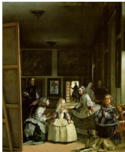
Fig. 19 - As meninas

Na tela de grandes dimensões encontram-se onze personagens mais um cão num amplo salão. Da esquerda para direita ocupando o primeiro plano do quadro vemos a parte posterior de uma grande tela esticada num chassi e apoiada num cavalete. Logo atrás num plano intermediário, uma dama de companhia agachada serve algo para a princesa Margarida, a herdeira do trono, de pé ao seu lado. À esquerda desta, outra dama de companhia faz uma