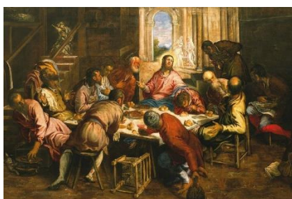
Fig. 12 - Última Ceia, Tintoretto, 1566

afrescos da última ceia de autorias de Leonardo da Vinci (Fig. 9), de Ghirlandaio (Fig. 10) e de Giotto (Fig. 11), respectivamente, e uma pintura sobre o mesmo tema de Tintoretto (Fig. 12). Segundo o filósofo, não se trata de fazer um juízo de valor sobre as obras, mas tão somente demonstrar de que modo a disposição dos personagens no espaço pictórico de cada autor é instrutiva, na medida em que nos permite apreender a relação entre “ordenação decorativa e conteúdo tonal espiritual”. Ou seja, de que modo a unidade de cada quadro é capaz de sintetizar a mimese imaginária com o sentimento religioso. Lukács diz que tal unidade “produz uma intensificação da infinitude de todos os detalhes e de tudo que abrange as suas relações internas” (LUKÁCS, 1972, p.175.), acentuação que leva uma composição a se tornar mais viva.