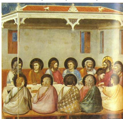
Fig. 11 - Última Ceia, Giotto, 1306