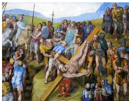
Fig. 2 - A crucificação de S. Pedro

Lukács destacará dois aspectos importantes da pintura no seu despertar para uma mimese “orientada para a universalidade” (LUKÁCS, 1972, p. 166). O filósofo nota, primeiramente, que o surgimento da pintura na Antiguidade histórica não tem conexão histórica alguma com o paleolítico, posto que, não somente a pintura renasce espontaneamente partindo de uma nova situação vital, como, em segundo lugar, é também qualitativamente diversa do paleolítico, não podendo ser continuação desta sob nenhum aspecto, devendo ser apreendida, do ponto de vista ornamental-decorativo, como uma nova consideração artística do mundo (LUKÁCS, 1972, p. 167). Diz ele inicialmente que, nessa nova condição, os princípios ordenadores decisivos da