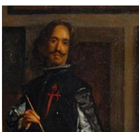
Fig. 16 - Autorretrato

número de oposições internas. Dentre os conflitos mais significativos citamos os observados entre o intelectualismo formalista do legado artístico da pintura da renascença clássica e a liberdade pictórica adotada por artistas como Parmigianino (Fig. 13, 1540), El Greco (Fig. 14, c. 1600), Caravaggio (Fig. 15, c. 1590) e Velázquez (Fig. 16, 1656), respectivamente, principais representantes das tendências estilísticas maneiristas e barrocas surgidas entre 1510 e 1670.