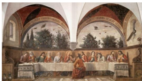
Fig. 10 - Última Ceia, Ghirlandaio, 1480