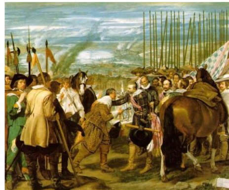
Fig. 5 - A rendição de Breda