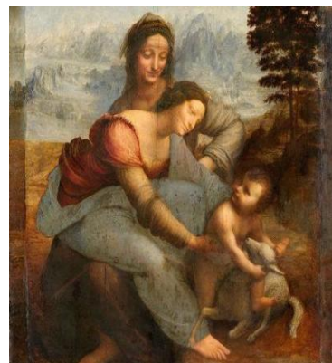
Fig. 6 - A virgem, o menino Jesus e Santa Ana

O geométrico aparece agora meramente como limite extremo da concentração mimética, quase como uma ideia reguladora , no sentido kantiano, determinando ao mesmo tempo tudo e nada na objetividade real 4 Sem embargo, um dos exemplos mais famosos desse tipo de composição é o quadro de Leonardo da Vinci, A virgem, o menino Jesus e Santa Ana (Fig. 6, 1503-1519). Segundo Wölfflin, trata-se de uma composição formando um triângulo equilátero, no qual todas as figuras se movem concentricamente e as direções opostas estão concentradas em formas fechadas. Para ele, Leonardo teria tentado preencher num espaço cada vez menor uma quantidade cada vez maior de conteúdos de movimento etc. Por seu turno, Lukács diz ser desnecessário estabelecer uma discussão especial com as ideias de Wölfflin, tendo como finalidade o esclarecimento do contraste entre a função artística de tal triângulo e a que ela teria em um ornamento verdadeiramente abstrato. Para o filósofo húngaro, no exemplo de Leonardo e dos artistas seus contemporâneos, a consequência da universalidade do trabalho na vida dos homens já pode ser afirmada objetivamente, algo que até o momento podíamos fazer apenas de uma maneira geral.